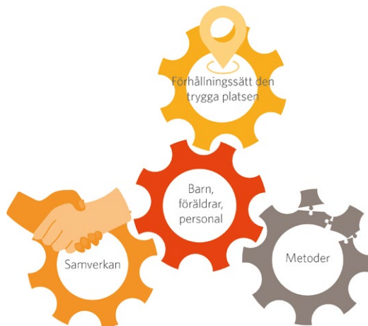
Arbetsmodellen på öppna förskolan Hera i Malmö